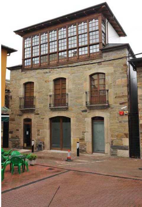
Fachada del M.AR.CA.

Desarrollar y llevar a término un proyecto de estas características, no resulta tarea fácil –casi nunca-, pero, mucho menos cuando se trata de una entidad del medio rural. La falta de medios materiales y humanos dificulta la ejecución perfecta del proyecto. En este trabajo, hay mucha voluntad, o trabajo de voluntariado patrimonial . Y es un deber, que desde estas páginas, se exprese el agradecimiento a muchas personas comprometidas con el Patrimonio, y al propio Patronato, pues, gracias a su colaboración desinteresada fue llevado a término el proyecto del M.AR.CA.