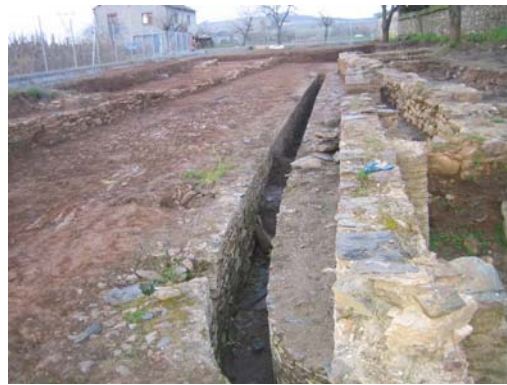
Solar arqueológico de La Edrada