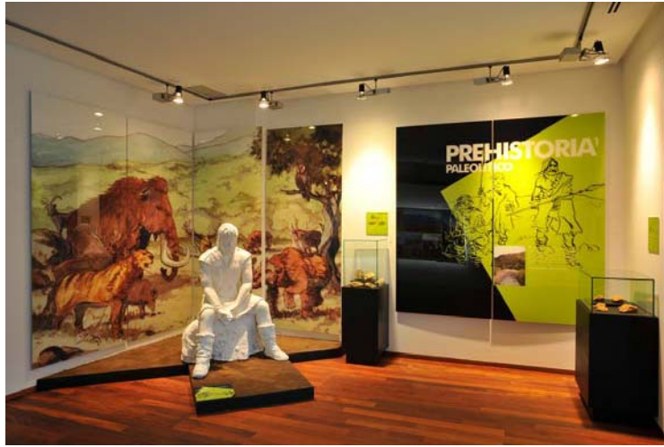
Sala de Prehistoria