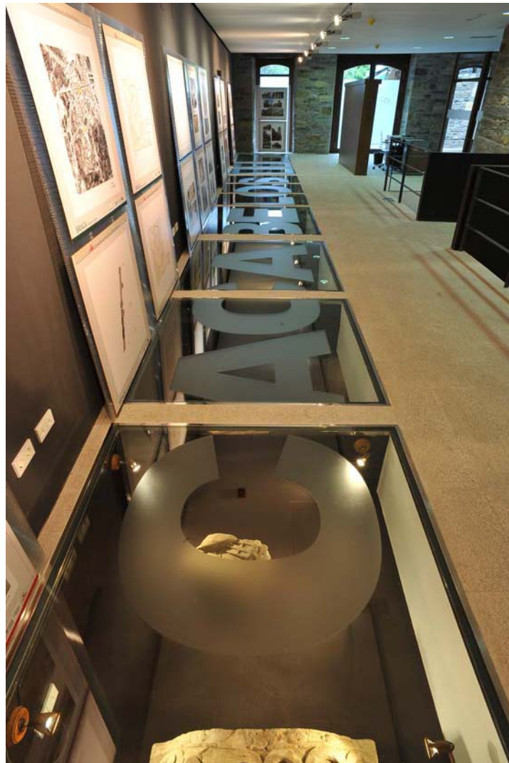
Sala de recepción y Exposiciones Temporales, con vista cenital de la exposición etnográfica del sótano.

El M.AR.CA. es una institución dependiente del Ayuntamiento de Cacabelos, propietario y gestor del mismo, concebido tal y como se define en el art.2, Título Primero de la ley de Museos de Castilla y León 10/1994, de 8 julio 1994: instituciones o centros de carácter permanente, abiertos al público, que reúnen, conservan, ordenan, documentan, investigan, difunden y exhiben de forma científica, didáctica y estética conjuntos y colecciones de valor histórico, artístico, científico, técnico o de cualquier otra naturaleza cultural, para fines de estudio, educación o contemplación. Incluido en la Red de Museos de Castilla y León en 2007, compatibiliza sus funciones con punto información turística, y centro cultural de la villa.