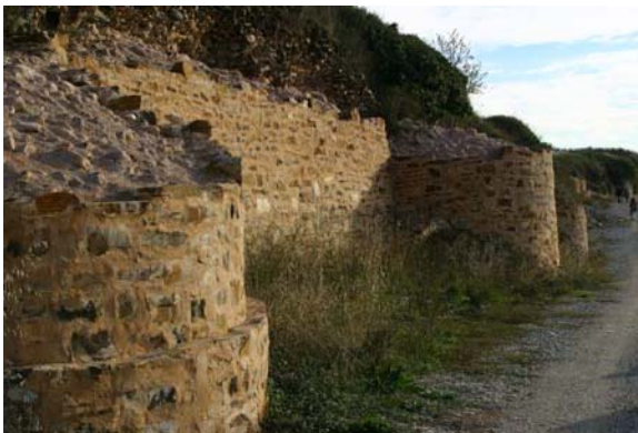
Murallas romanas de Castro Ventosa

Este hecho convierte a Bergidum 2 en el centro neurálgico de comunicaciones y administración de toda la comarca en época antigua y medieval. Pero además, los vestigios visibles, les atribuyen ser los más antiguos y mejor conservados: Castro Ventosa con muralla tardoimperial romana de 1.200 m., y La Edrada con los únicos vestigios urbanos romanos de toda la comarca.