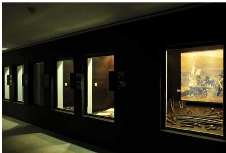
Sótano, vista frontal de los tinos o vitrinas