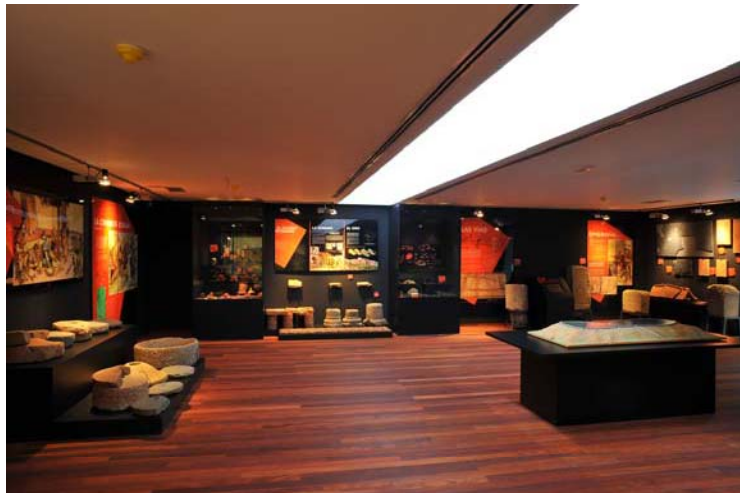
Sala de Astures y Romanos